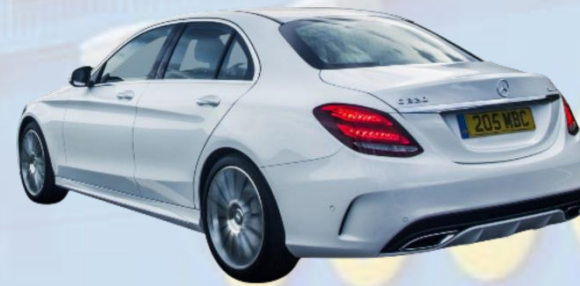
Mercedes Clase C 220 d W205.