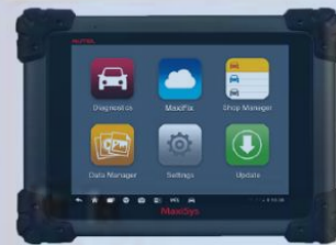
MS - 908