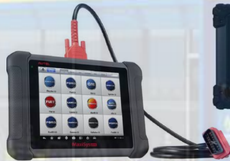
MS - 906