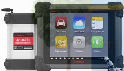
MS - 908 PRO